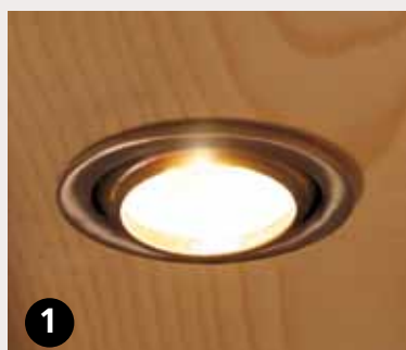
❶ Dachkranzleuchten à 20 Watt

Durch Schraubabdeckkappen werden alle außen liegenden Schrauben optimal verdeckt.