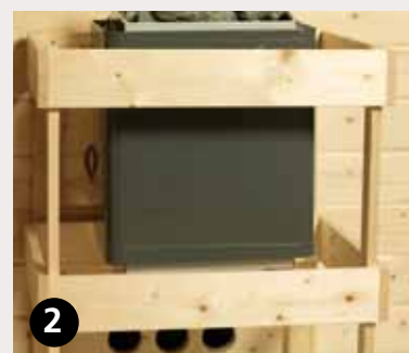
2 Ofenschutzgitter Standard