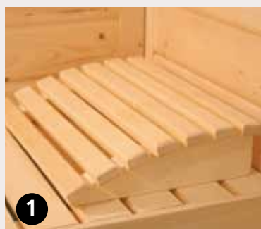
1 Kopfstütze Premium